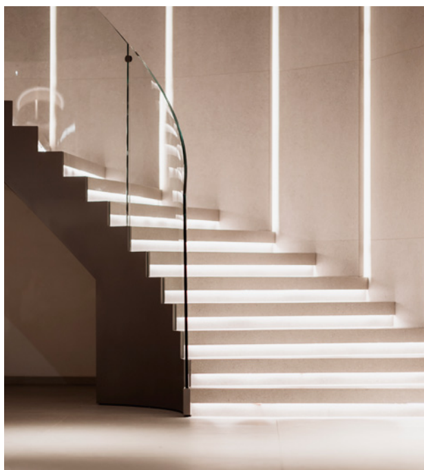
Il futuro nella percezione degli spazi

IN TEMPI COME QUESTI, LA CASA E DESTINAZIONI SICURE SI RIVALUTANO. CON ESSE, L'ARTIGIANATO RITROVA UN RUOLO ESSENZIALE: DARE FORMA A UN LIVING DI ALTA QUALITÀ, AUTENTICO E ACCOGLIENTE, ANCHE NEL MONDO DEL TURISMO.