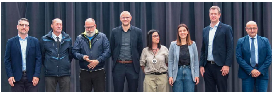
I vertici paritetici della Cassa Edile durante la cerimonia

“30 anni di fiducia” è stato quindi volutamente il motto delle premiazioni. La celebrazione è stata l'occasione per mettere in primo piano non gli appuntamenti quotidiani o i programmi dei cantieri, ma le persone che da decenni sostengono il settore.