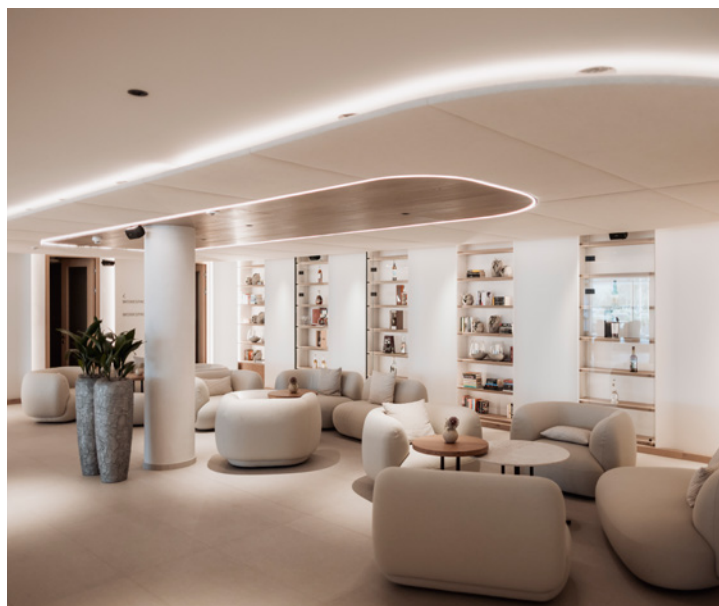
Desiderio di atmosfera

Fino a pochi anni fa contava un unico principio: la massima luminosità possibile. Oggi, invece, il design illuminotecnico moderno segue un approccio del tutto diverso: si vuole creare atmosfera. La luce si usa in modo mirato per dare un'impronta emotiva agli spazi, definire aree e arredi, generare atmosfere diverse. Luce di tonalità calda, illuminazione indiretta e accenti mirati caratterizzano le concezioni attuali. Le zone più buie oggi non sono più viste come un problema ma come parte importante di una drammaturgia degli spazi. Soprattutto le aree wellness, i bar e le lounge degli hotel, i ristoranti o le lobby vivono di atmosfere luminose diversificate.