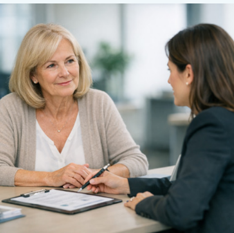
Pensplan: sempre ben consigliati per la pensione

MOLTE IMPRESE ARTIGIANE HANNO DIFFICOLTÀ A PARTECIPARE AGLI APPALTI PUBBLICI – NON PER MANCANZA DI INTERESSE O COMPETENZE, MA A CAUSA DELLE INCERTEZZE LEGATE AI CONTRATTI COLLETTIVI.