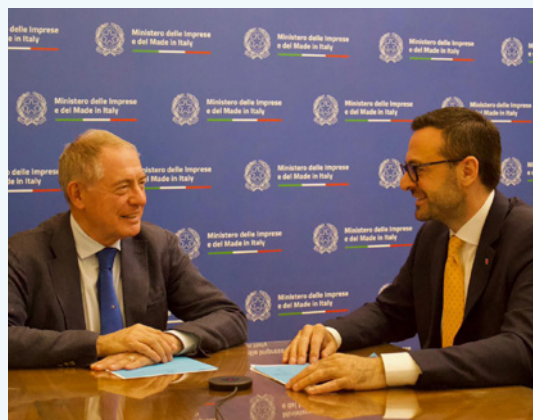
Riconoscimento per l'artigianato altoatesino: Marco Galateo e Adolfo Urso a colloquio.

Durante l'incontro tra l'assessore provinciale allo sviluppo economico Marco Galateo e il ministro Adolfo Urso, al centro dell'attenzione non vi è stata soltanto la riforma della legge nazionale sull'artigianato, ma anche la consapevolezza che molte professioni rappresentano molto più di semplici fattori economici. Il punto di partenza del confronto è stata una richiesta avanzata da lvh.apa: le imprese artigiane necessitano di condizioni giuridiche più moderne e di un sostegno più forte, soprattutto in un periodo in cui il sapere professionale e la tradizione sono sempre più sotto pressione. Questo aspetto emerge in modo particolarmente evidente nel caso delle fumiste e dei fumisti. In Alto Adige la professione è riconosciuta per legge, mentre al di fuori della provincia questa tutela viene spesso a mancare. Per i soggetti coinvolti si tratta di un problema rilevante, perché con la scomparsa della professione non si perde soltanto un servizio, ma anche un patrimonio di conoscenze costruito nel corso di decenni. «Ribadiamo il ruolo strategico centrale delle imprese artigiane per il nostro territorio», ha dichiarato