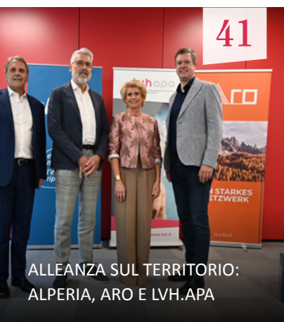
ALLEANZA SUL TERRITORIO: ALPERIA, ARO E LVH.APA