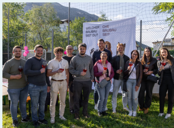
Numerosi ospiti hanno preso parte all'evento