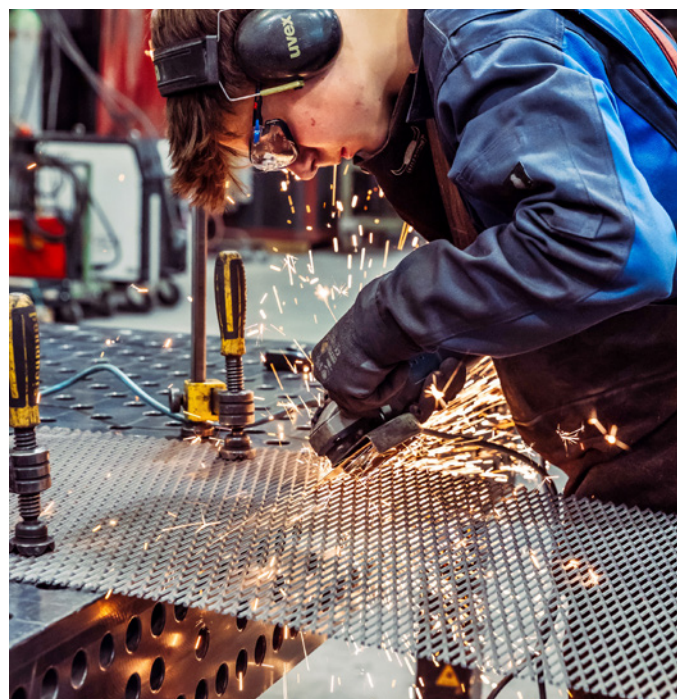
Non solo il futuro dell'artigianato, ma anche quello della nostra provincia: gli studenti delle scuole professionali dell'Alto Adige