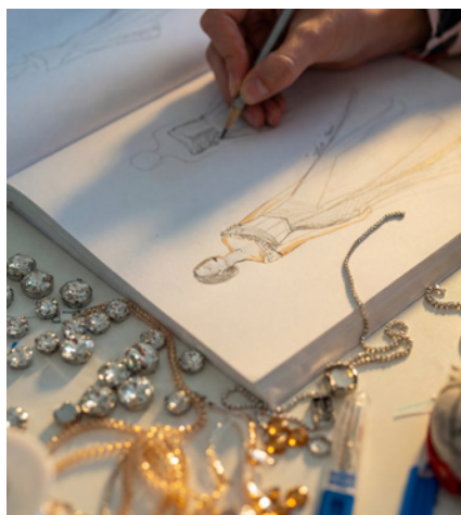
Individualità: il focus della seconda parte della campagna

Le conseguenze vanno oltre l'armadio. L'individualità diventa un atteggiamento – e una risposta a un sistema basato sulla sovrapproduzione. L'abbigliamento su misura non è solo più preciso, ma anche più duraturo. Viene indossato, non sostituito. Riduce ciò che viene altrimenti prodotto dall'industria: l'eccesso.