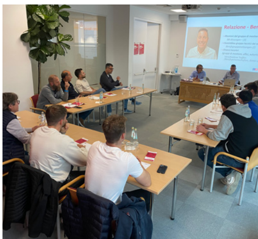
Lo scambio professionale è stato al centro dell'incontro

QUANDO SI PARLA DI OBIETTIVI CLIMATICI RARAMENTE SI PRENDONO IN CONSIDERAZIONE I BRUCIATORISTI. EPPURE SONO PROPRIO LORO A RENDERE CONCRETA LA TRANSIZIONE ENERGETICA, OGNI GIORNO, IN CENTRALI TERMICHE, CANTINE E OFFICINE.