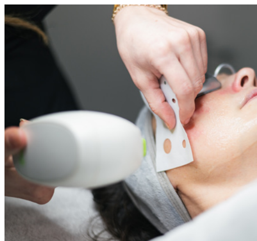
Sicurezza e competenze al centro di un trattamento laser

Spesso si parla di corsi obbligatori di 20 ore. In realtà la norma non prevede un numero fisso di ore, ma definisce piuttosto quali competenze, conoscenze e misure di sicurezza sono richieste – ad esempio nei settori della fisica, della valutazione del rischio, delle misure di protezione e delle istruzioni operative. Il messaggio del corso è quindi chiaro: l'estetica oggi non riguarda più soltanto bellezza e consulenza. Sempre più spesso include anche competenze tecniche, sicurezza degli apparecchi e gestione professionale del rischio. Proprio per questo la formazione continua e la qualificazione nel settore dell'estetica stanno diventando sempre più importanti.