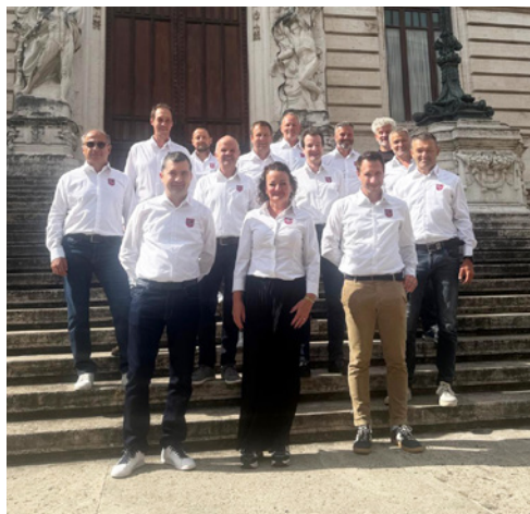
Il gruppo a Roma

Alla fine è rimasto molto più di un semplice viaggio formativo. Sono stati quattro giorni ricchi di scambio, comunità e impressioni che continueranno probabilmente a lasciare il segno ancora a lungo.