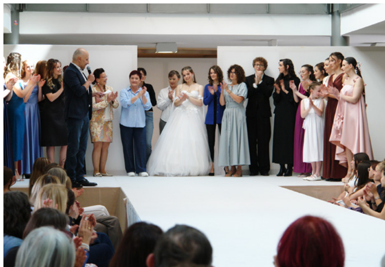
Un evento riuscito: la sfilata di moda del centro di Merano