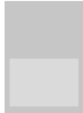
1/2 Seite quer