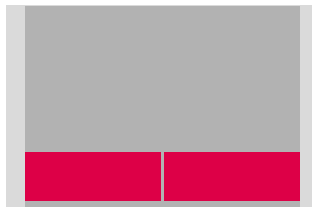
720 × 250 px Auflösung 300 dpi