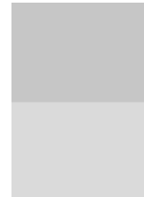
1/2 Seite quer