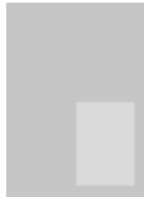
1/4 Seite hoch