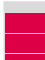
730 × 350 px Auflösung 300 dpi