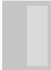
1/2 Seite hoch