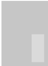
1/6 Seite hoch