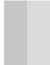
1/2 Seite hoch